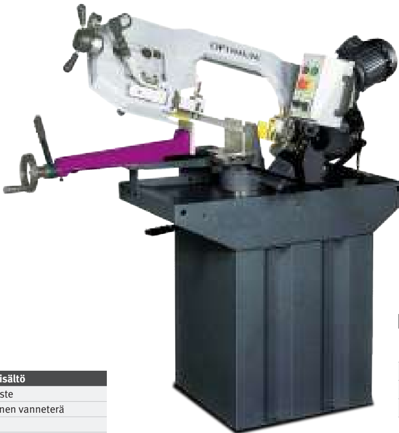
Kuva: S 275N